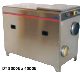
DT 3500E à 4500E