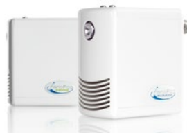
Vier Vernebler der Serie „DRAABE NanoFog Evolution“ sichern ganzjährig eine optimale Luftfeuchtigkeit im neuen JURA-Gebäude

tausch der Wasseraufbereitungseinheit und dem Check des gesamten Systems garantiert Condair Systems einen störungsfreien und hygienisch sicheren Einsatz der DRAABE Luftbefeuchtungsanlage. Für JURA als Anwender ist das System daher wartungsfrei.