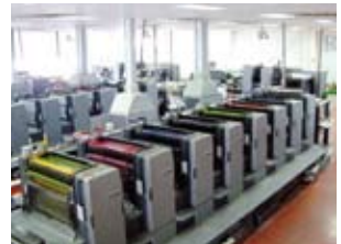
100 % de planéité dans l'atelier d'impression