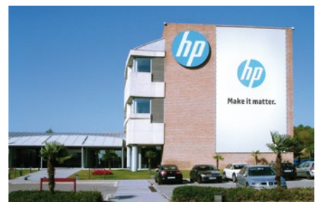
HP Demo- und Trainingscenter bei Barcelona