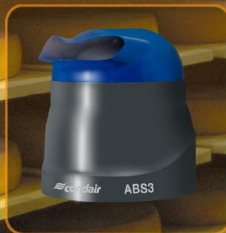
Condair ABS3: un appareil puissant et polyvalent

Horizontal ou vertical ? Les diffuseurs de cet atomiseur compact dispersent le fin brouillard d'aérosol sans gouttes dans la direction choisie. L'appareil se nettoie en un tour de main. C'est vous qui décidez si vous souhaitez raccorder votre Condair 505 au réseau d'eau ou remplir le réservoir d'eau manuellement.