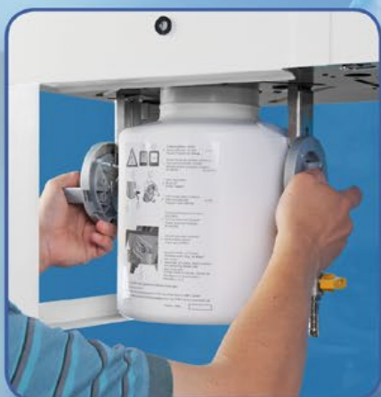
Bac collecteur de calcaire externe

Le bac collecteur de calcaire externe permet d'allonger de façon considérable les intervalles de maintenance et de réduire au minimum les manipulations nécessaires à l'entretien. Situé à l'extérieur et en-dessous de l'appareil, le bac collecteur de calcaire est facilement accessible. Il peut être retiré et vidé sans ouvrir le boîtier de l'appareil. La maintenance est donc un jeu d'enfant et s'effectue en un temps record.