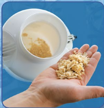
Système breveté de gestion du calcaire

Le bac collecteur de calcaire externe permet d'allonger de façon considérable les intervalles de maintenance et de réduire au minimum les manipulations nécessaires à l'entretien. Situé à l'extérieur et en-dessous de l'appareil, le bac collecteur de calcaire est facilement accessible. Il peut être retiré et vidé sans ouvrir le boîtier de l'appareil. La maintenance est donc un jeu d'enfant et s'effectue en un temps record.