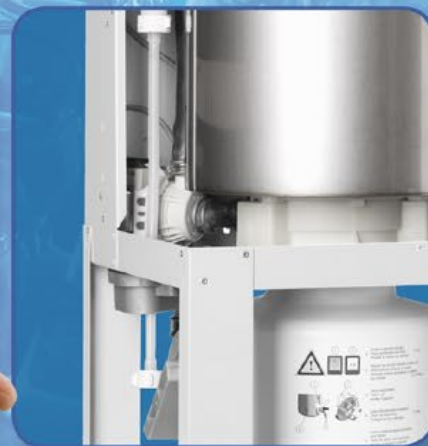
Eau de rinçage du cylindre sans calcaire

Durant le service, le système breveté de gestion du calcaire évacue les dépôts de minéraux du cylindre à vapeur et les conduit automatiquement dans le bac collecteur de calcaire prévu à cet effet. Les dépôts calcaires s'y amoncellent et peuvent ensuite être éliminés en toute simplicité. Les travaux de maintenance s'en trouvent considérablement réduits et la sécurité de fonctionnement atteint un niveau optimal. Le système breveté de gestion du calcaire garantit ainsi une maintenance rapide et une longue durée de vie des humidificateurs d'air à vapeur Mk5.