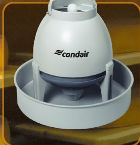
Condair 3001: der Supersichere

Horizontal oder vertikal? Die Richtaufsätze dieses kompakten Zerstäubers lassen den feinen Aerosolnebel tropfenfrei in die gewählte Richtung austreten. Das Gerät lässt sich mit wenigen Handgriffen reinigen. Und Sie entscheiden, ob Sie Ihren Condair 505 ans Wassernetz anschliessen möchten oder den Wassertank manuell nachfüllen wollen.